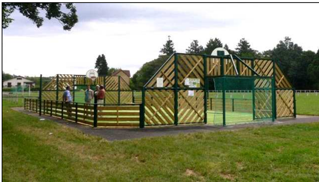
Agorespace 250MB 2 Cup / Vallon en Sully

L'Agorathlon est une occasion unique d'animer un terrain multisports Agorespace mais c'est aussi la possibilité de faire découvrir et pratiquer différents sports aux jeunes, développer chez eux l'esprit d'équipe et de compétition, leur enseigner les règles d'utilisation de l'équipement. C'est également un bon moyen pour les jeunes des communes voisines de se rencontrer.