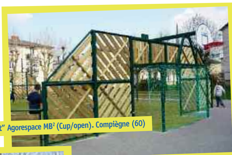
Terrain "Test" Agorespace MB 2 (Cup/open). Compiègne (60)

Agorespace proposera des "visites guidées découverte" pour ces premiers sites. Rendez-vous à prendre en nous contactant.