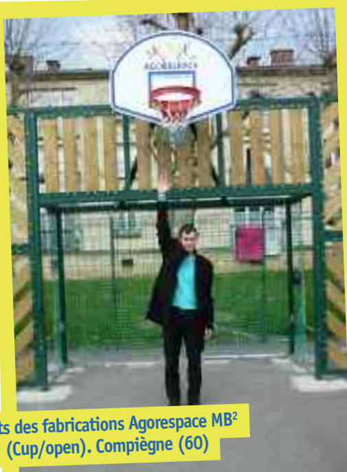
Tests des fabrications Agorespace MB 2 (Cup/open). Compiègne (60)