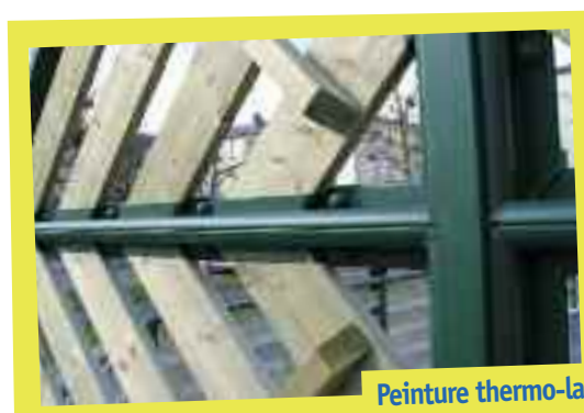
Peinture thermo-laquée au téflon : anti-rayure, autonettoyante