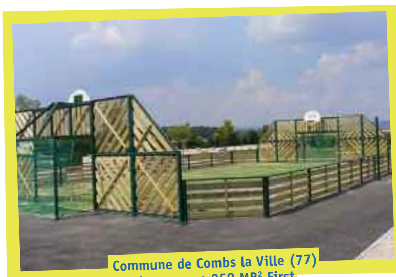
Commune de Combs la Ville (77) Agorespace 250 MB 2 First