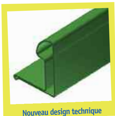
Nouveau design technique